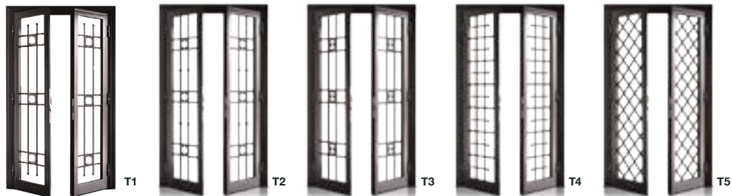
Tubolari Tondi Rounded Tubulars