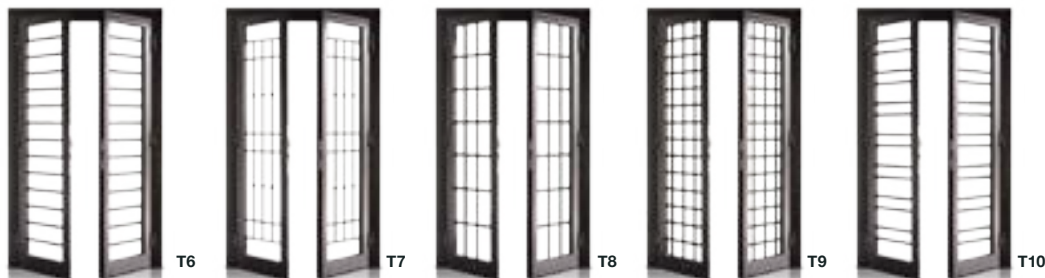
Tubolari Squadrati Squared Tubulars